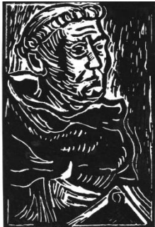
Zwei Mal... Zwei Mal...